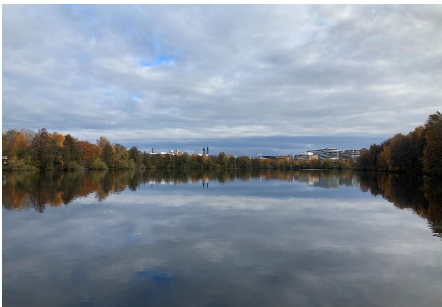
Figur 3. Sjön Trekanten omges av en trädridå som ger fladdermöss både skydd från rovfåglar samt vindstilla födosöksplatser där det samlas mycket insekter.